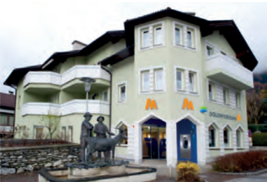
Geschäftsstelle Matrei Tauerntalstraße 1 9971 Matrei Tel.: +43 4875 / 5252 - 0