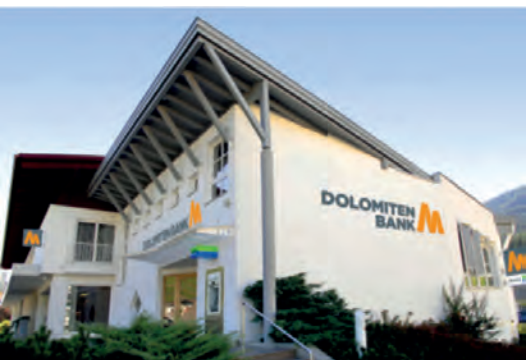
Geschäftsstelle Heinfels Panzendorf 150 9919 Heinfels Tel.: +43 4842 / 5151 - 0