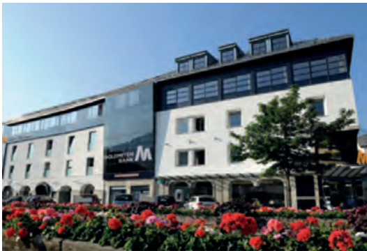
Zentrale Lienz Südtiroler Platz 9 9900 Lienz Tel.: +43 4852 / 6665 - 0