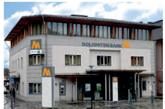
Hauptgeschäftsstelle Kötschach Kötschach 20 9640 Kötschach-Mauthen Tel.: +43 4715 / 305 - 0