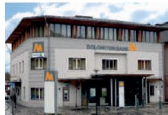
Hauptgeschäftsstelle Kötschach Kötschach 20 9640 Kötschach-Mauthen Tel.: +43 4715 / 305 - 0