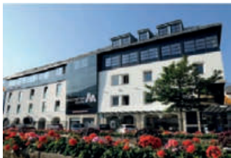
Zentrale Lienz Südtiroler Platz 9 9900 Lienz Tel.: +43 4852 / 6665 - 0