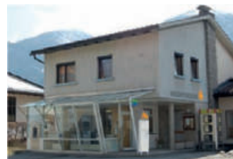
Geschäftsstelle Gundersheim Gundersheim 67 9634 Gundersheim Tel.: +43 4718 / 348 - 0