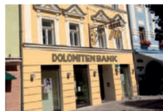
Hauptgeschäftsstelle Gmünd Hauptplatz 22 9853 Gmünd Tel.: +43 4732 / 2210 - 0