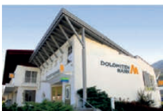
Geschäftsstelle Heinfels Panzendorf 150 9919 Heinfels Tel.: +43 4842 / 5151 - 0