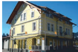
Geschäftsstelle Hermagor Bahnhofstraße 12 9620 Hermagor Tel.: +43 4282 / 3744 - 0