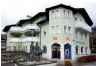
Geschäftsstelle Matrei Tauerntalstraße 1 9971 Matrei Tel.: +43 4875 / 5252 - 0