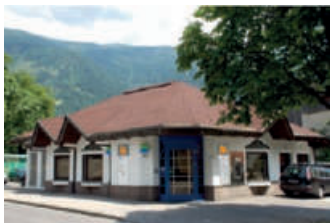
Geschäftsstelle Michaelsplatz Michaelsplatz 24 9900 Lienz Tel.: +43 4852 / 63811 - 0