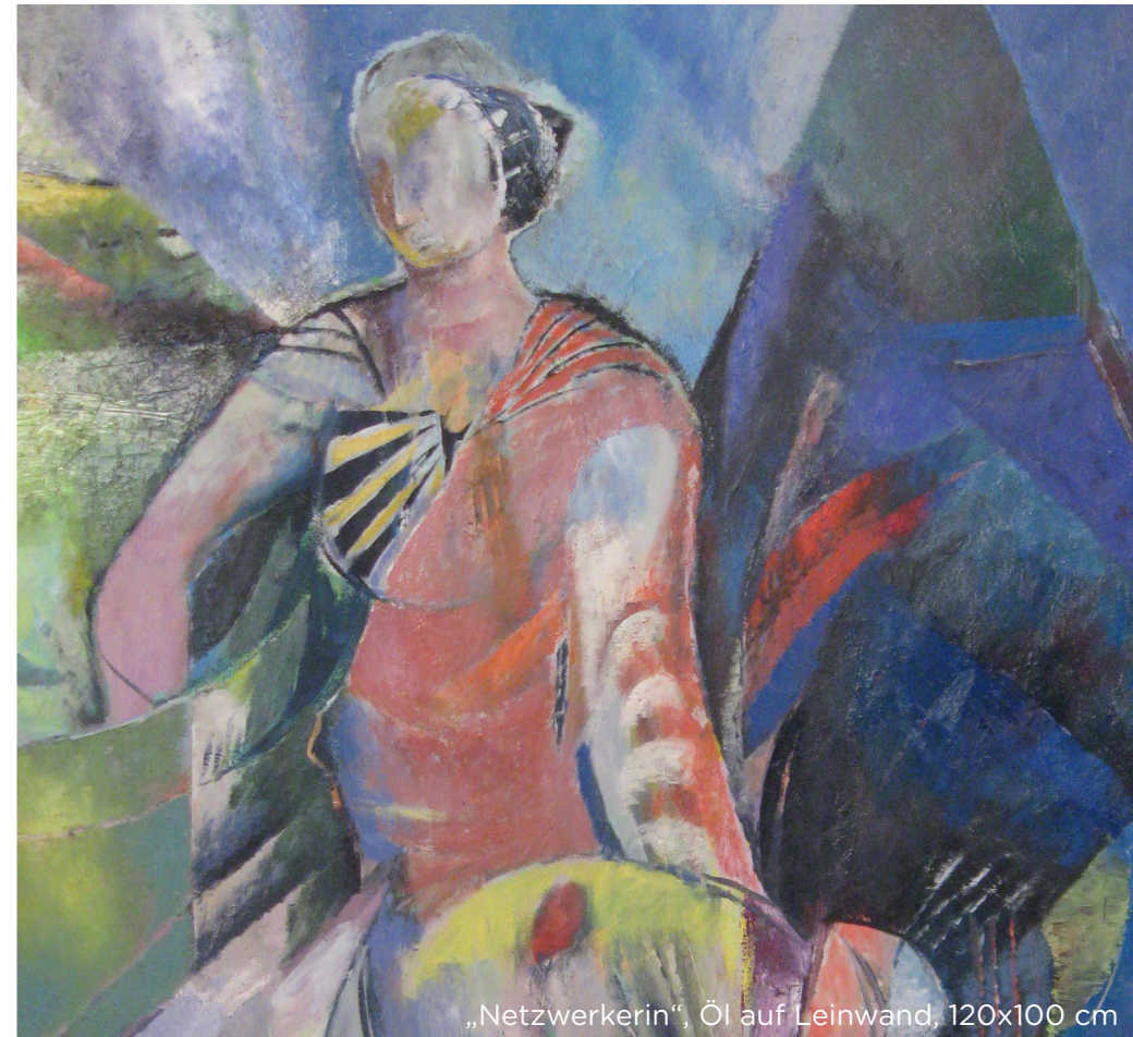
„Netzwerkerin“, Öl auf Leinwand, 120x100 cm