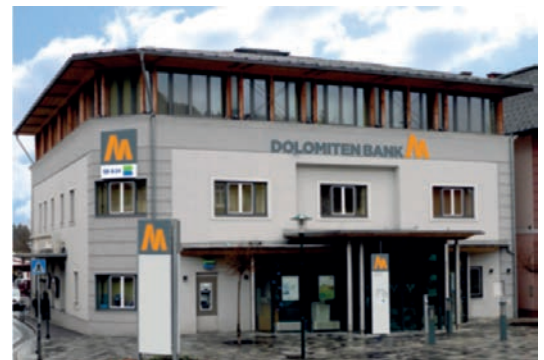
Hauptgeschäftsstelle Kötschach Kötschach 20 9640 Kötschach-Mauthen Tel.: +43 4715 / 305 - 0