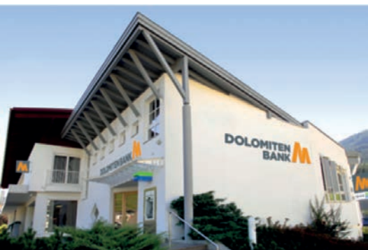
Geschäftsstelle Heinfels Panzendorf 150 9919 Heinfels Tel.: +43 4842 / 5151 - 0