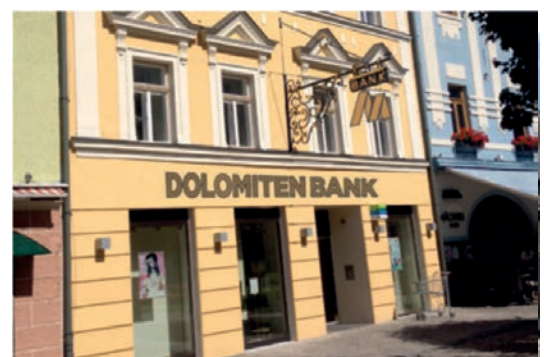
Hauptgeschäftsstelle Gmünd Hauptplatz 22 9853 Gmünd Tel.: +43 4732 / 2210 - 0