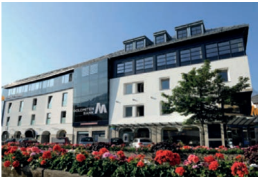
Zentrale Lienz Südtiroler Platz 9 9900 Lienz Tel.: +43 4852 / 6665 - 0