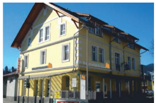
Geschäftsstelle Hermagor Bahnhofstraße 12 9620 Hermagor Tel.: +43 4282 / 3744 - 0