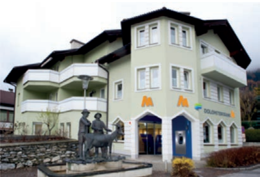
Geschäftsstelle Matrei Tauerntalstraße 1 9971 Matrei Tel.: +43 4875 / 5252 - 0