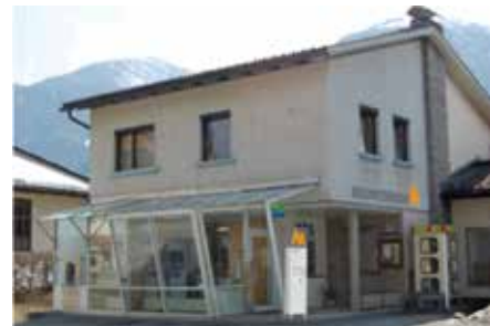
Geschäftsstelle Gundersheim Gundersheim 67 9634 Gundersheim Tel.: +43 4718 / 348 - 0