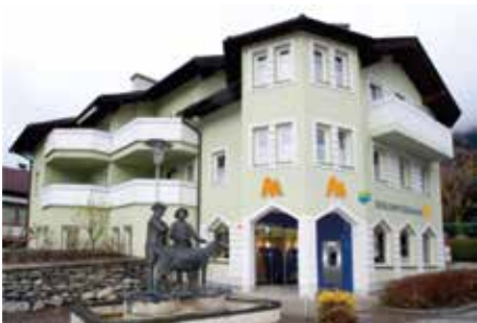
Geschäftsstelle Matri Tauerntalstraße 1 9971 Matri Tel.: +43 4875 / 5252 - 0