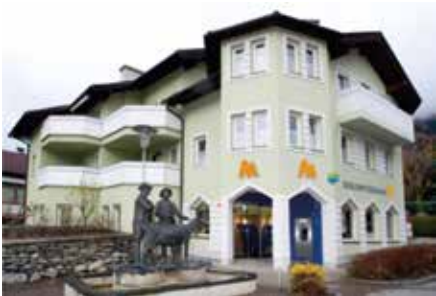
Geschäftsstelle Matri Tauerntalstraße 1 9971 Matri Tel.: +43 4875 / 5252 - 0