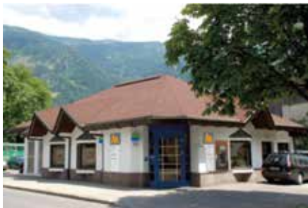
Geschäftsstelle Michaelsplatz Michaelsplatz 24 9900 Lienz Tel.: +43 4852 / 63811 - 0