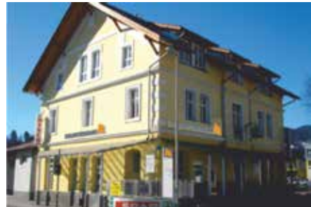
Geschäftsstelle Hermagor Bahnhofstraße 12 9620 Hermagor Tel.: +43 4282 / 3744 - 0