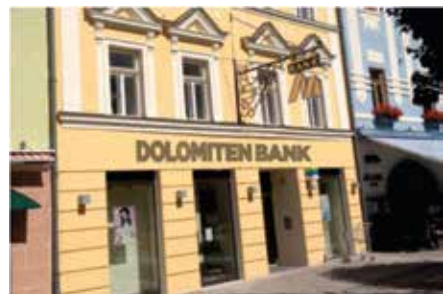
Hauptgeschäftsstelle Gmünd Hauptplatz 22 9853 Gmünd Tel.: +43 4732 / 2210 - 0