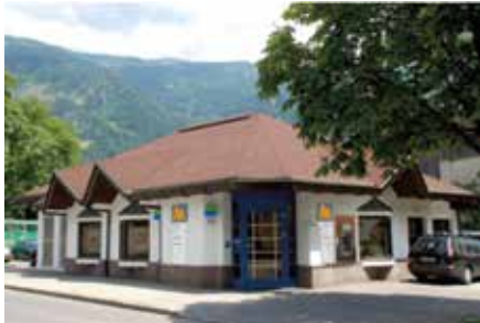
Geschäftsstelle Michaelsplatz Michaelsplatz 24 9900 Lienz Tel.: +43 4852 / 63811 - 0