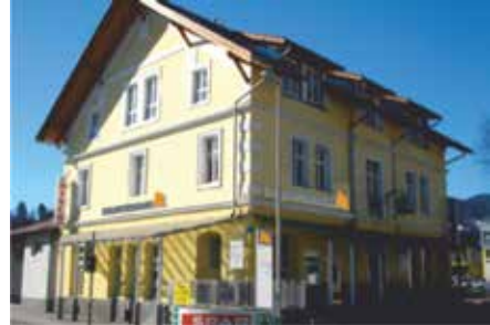
Geschäftsstelle Hermagor Bahnhofstraße 12 9620 Hermagor Tel.: +43 4282 / 3744 - 0