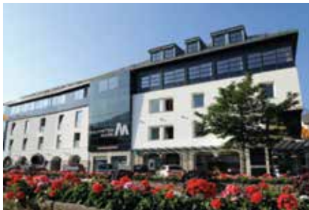
Zentrale Lienz Südtiroler Platz 9 9900 Lienz Tel.: +43 4852 / 6665 - 0